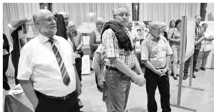
Interessierte Gäste beim Gemeindeforum am 15. September.

Die Stellwände mit den Plakaten der Gruppen und Chöre bleiben noch bis zum Erntedankfest im Gemeindehaus ausgestellt und können sonntags nach dem Gottesdienst oder unter der Woche während der Öffnungszeiten für die Gruppen und Kreise betrachtet werden.